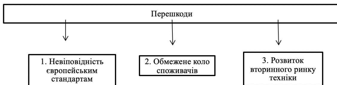
Рис. 3. Основні перешкоди для розвитку міжнародної конкурентоспроможності українських сільгоспмашинобудівних підприємств

2013-2015 років, спостерігається значне збільшення загальних обсягів продажу техніки як на внутрішньому, так і на зовнішніх ринках.