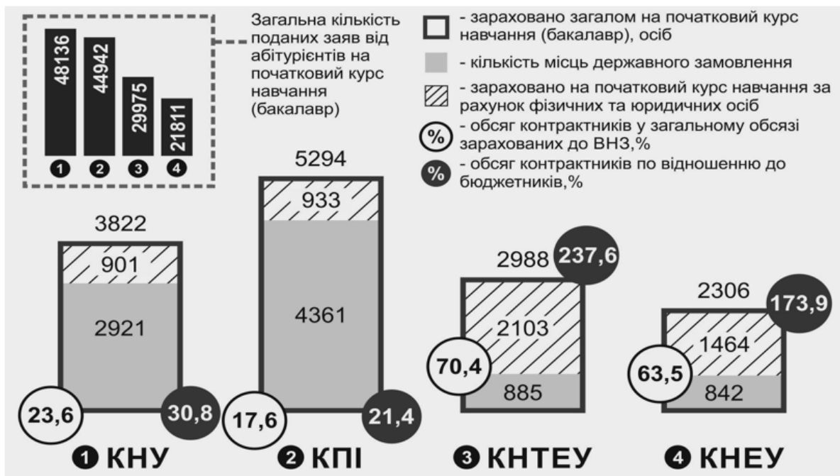
Рис.1. Результати вступної кампанії 2014 (початковий курс навчання (освітній ступінь «бакалавр»)), осіб

Значний вплив держзамовлення на фінансове забезпечення закладу вищої освіти можна підтвердити, прив'язавши кількості поданих заяв від абітурієнтів до обсягів держзамовлення для конкретного ЗВО на прикладі популярних університетів м. Києва (дані вступної компанії 2014 року), а саме: Київського національного університету імені Тараса Шевченка (КНУ), Національного технічного університету України «Київський політехнічний інститут ім. Ігоря Сікорського» (КПІ), Київського національного торговельно-економічного університету (КНТЕУ) та Київського національного економічного університету імені Вадима Гетьмана (КНЕУ) [8].