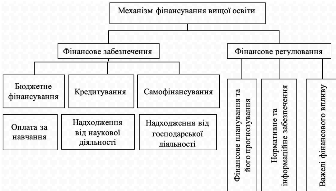
Рис. 1 Механізм фінансування вищої освіти України Джерело: складено автором на основі [4; 3; 5]

Наведений механізм є прикладом функціонування двох важливих підсистем: