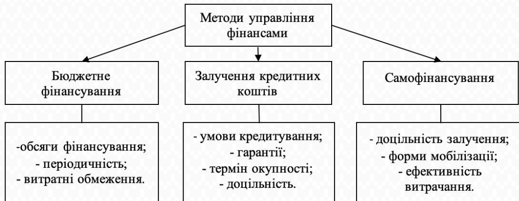
Рис. 2 Методи управління фінансовими ресурсами закладів вищої освіти