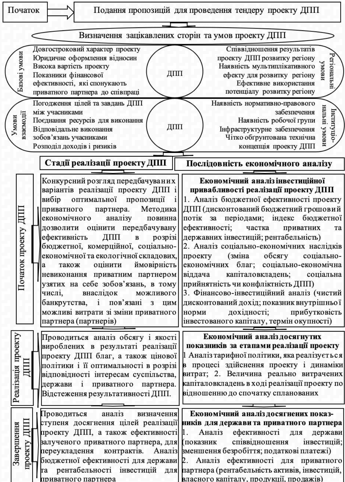
Рис. 2 Концептуальна модель економічного аналізу реалізації ДПП