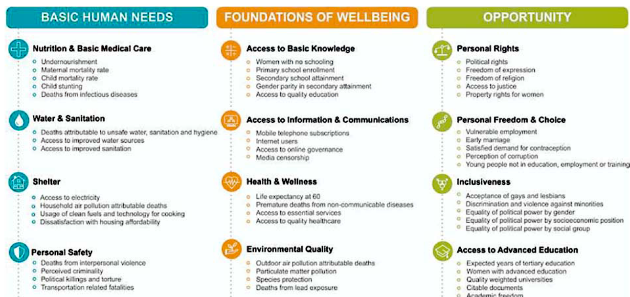
Рис. 2. Структура системи показників під час визначення індексу соціального розвитку країни [4, с. 3]

Індекс соціального розвитку має також велике значення для аналізу динаміки досягнення цілей сталого розвитку, що були задекларовані у документі Саміту ООН «Перетворення нашого світу: порядок денний