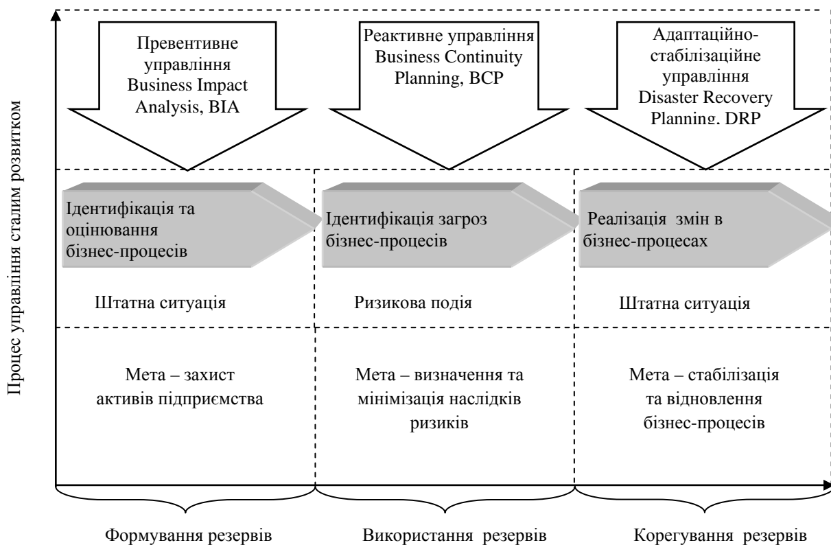
Рис. 1. Просторово-часовий континуум процесу управління сталим розвитком на основі технології non-stop Побудовано авторами

Актуальність забезпечення безперервності бізнесу обумовлена необхідністю збереження (підвищення) стійкості і стабільності функціонування бізнес-одиниці, що стає можливим за умови формування обліково-аналітичного забезпечення управління ризиками і кризами в умовах несприятливого впливу зовнішніх і внутрішніх факторів. Тому вважаємо задля організації моніторингу попереджувальної протидії, виявлення слабких місць процесу аналізу планування та відновлення безперервності бізнесу доцільно змодельовати просторово-часовий континуум (від лат. continuum – безперервне, суцільне) у вигляді фізичної моделі, що заповнює простір рівноправним тимчасовим виміром, в якому досліджуються вплив ділових процесів (штатна ситуація або ризикова подія) на формування резервів (рис. 1).