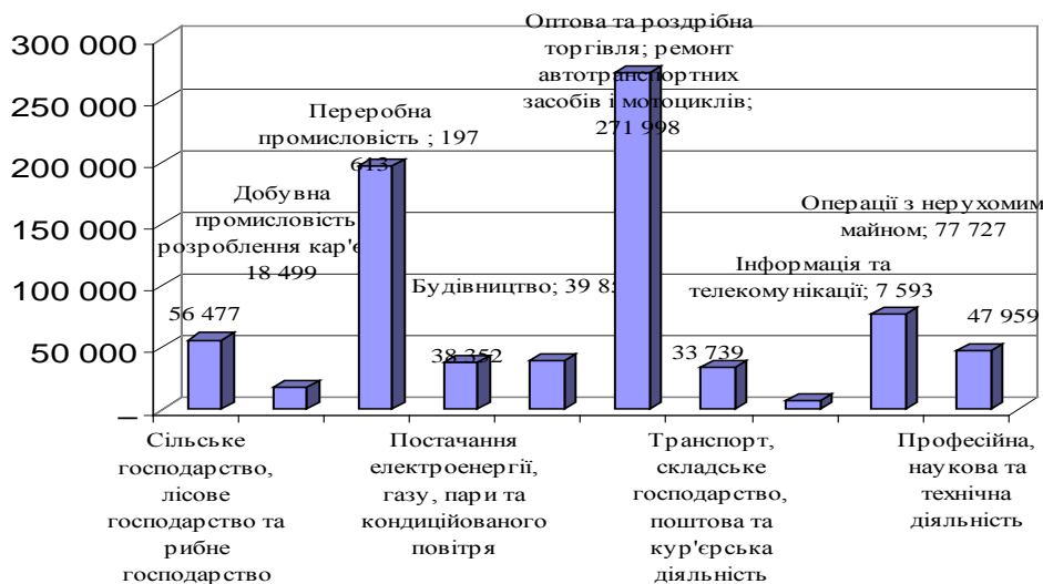
Рис. 2 Кредити, надані нефінансовим корпораціям, за видами економічної діяльності, станом на 29.06.2016 р., млн. грн. Складено на основі [10]

Найбільша сума кредитів надана підприємствам оптової та роздрібної торгівлі (271 998 млн. грн.), підприємствам переробної промисловості (197 613 млн. грн.), сільськогосподарським підприємствам (56 477 млн. грн.).